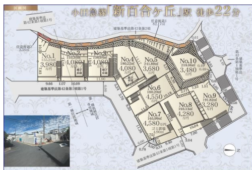
景観計画区域、日影規制

現況と異なる場合には現況を優先します。 該当物件が建築条件付き宅地だった場合、土地売買契約締結後3カ月以内に売主と住宅の建築請負契約を締結していただくことを条件として販売いたします。 この期間内に住宅を建築しないことが確定したとき、または住宅の建築請負契約が成立しなかった場合は、土地売買契約は無効となり、 受領した金額は全額無利息でお返しします。