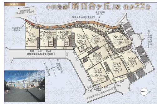
景観計画区域、日影規制、造成工事了予定2025年8月下旬

現況と異なる場合には現況を優先します。 該当物件が建築条件付き宅地だった場合、土地売買契約締結後3カ月以内に売主と住宅の建築請負契約を締結していただくことを条件として販売いたします。 この期間内に住宅を建築しないことが確定したとき、または住宅の建築請負契約が成立しなかった場合は、土地売買契約は無効となり、 受領した金額は全額無利息でお返しします。